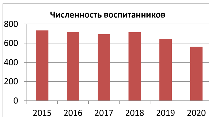
Рисунок 1 – численность воспитанников образовательных организаций, осуществляющих образовательную деятельность по образовательным программам дошкольного образования, в чел.

Дошкольные образовательные организации на конец 2020 года посещал 541 ребенок (2019 год – 644 ребенка, 2018 год – 642 ребенка, 2017 год – 691 ребенок, 2016 год – 715 детей). Детские сады города имели нормативную наполняемость, сельские дошкольные группы посещало 43 ребенка.