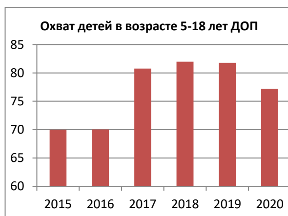
Рисунок 3 – удельный вес численности детей, получающих услуги дополнительного образования, в общей численности детей в возрасте 5-18 лет, в %.

Федеральный проект «Успех каждого ребенка» нацелен на формирование эффективной системы выявления и развития способностей и талантов детей и молодежи. В 2020 году в районе охват детей в возрасте от 5 до 18 лет дополнительным образованием составляет 77,52% (Вологодская область – 77%). Вовлечение детей с ОВЗ, детей - инвалидов в систему дополнительного образования – наша общая задача. Сегодня 81,39% особенных детей охвачено дополнительным образованием. В районе достаточно высокий процент охвата детей дополнительными общеразвивающими программами технической, естественнонаучной направленности – 28,51%.